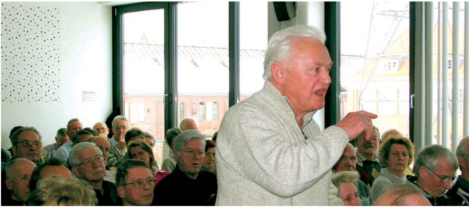
Immer streitbare Diskussionen im Sommersemester 2005 des Seniorenseminars.