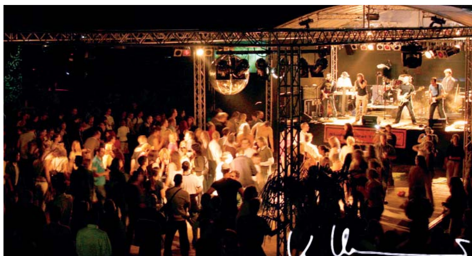
Beste Stimmung zum TFH-Campusfest 2005 bis spät in die Nacht: Blick auf die Hauptbühne und die große Tanzfläche während des Konzerts der Showband »Madhouse Flowers« (Bild oben) – Lichtinstallationen von Colophon.de (Bild unten).

Namentlich gekennzeichnete Beiträge geben nicht unbedingt die Meinung des Herausgebers und der Redaktion wieder.