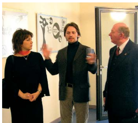
Eröffnung der Ausstellung »Digital Feeling in Wildau - Pixelkunst aus Ungarn« am 22. April 2005 im Haus 13.

Ein Stargast aus Ungarn rundete den Tag mit einem besonderen kulturellen Höhepunkt ab: Sándor Déki Lakatos und sein Orchester ließen in einem Konzert im Volkshaus Wildau traditionelle Volksmusik, Klassiker und Jazz erklingen.