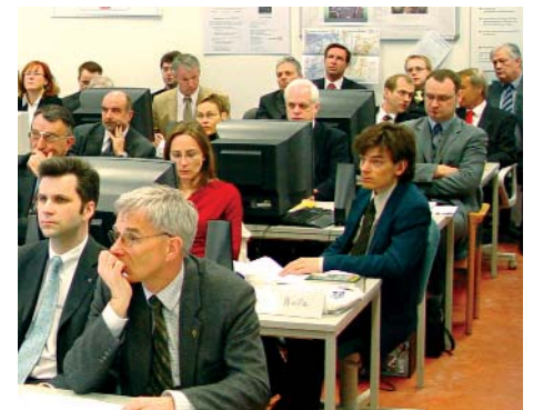
Aufmerksame Zuhörer aus dem In- und Ausland während der Ergebnispräsentation zum VDP-System.

Es ist geplant, das entwickelte System durch einen Fortsetzungsantrag auf eine gesamt-europäische Dimension zu heben und somit den neuen EU-Partnern unmittelbaren Zugriff sowie eigene Entwicklungsleistungen zu ermöglichen. Prof. Dr.-Ing. habil. B. Hentschel